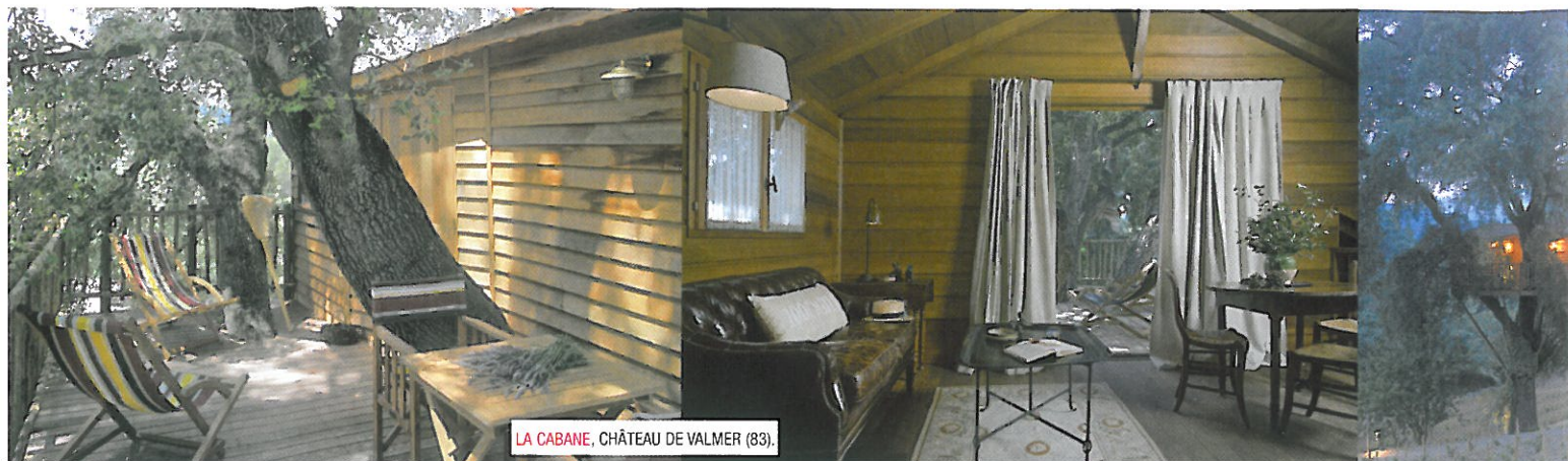
LA CABANE, CHÂTEAU DE VALMER (83).

Sur la presqu'île de Saint-Tropez, à quelques mètres de la plage de Gigaro à La Croix Valmer (83), découvrez La Cabane à 6 mètres du sol dans les vignes du Château Valmer. Elle est parfaitement intégrée au cœur d'un chêne centenaire et dotée d'une belle terrasse panoramique avec vue sur le vignoble du château et la grande bleue. Inaugurée en 2004, elle est la chambre la plus prisée du château.